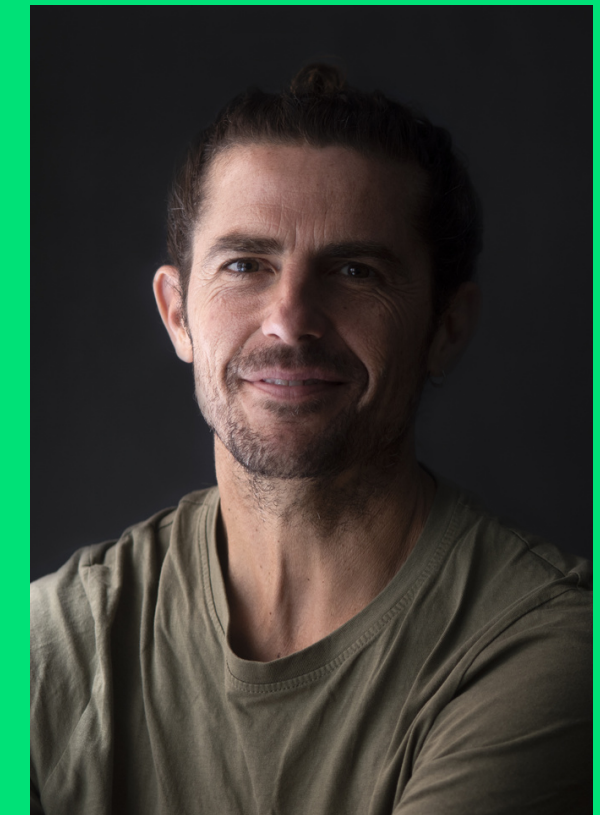
Juanjo Vázquez Producción ejecutiva